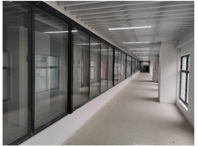
二层机房参观走道