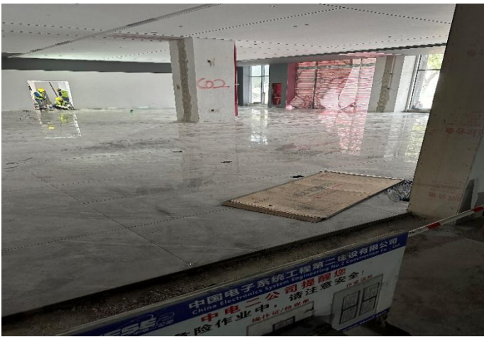
一层公共区域装修